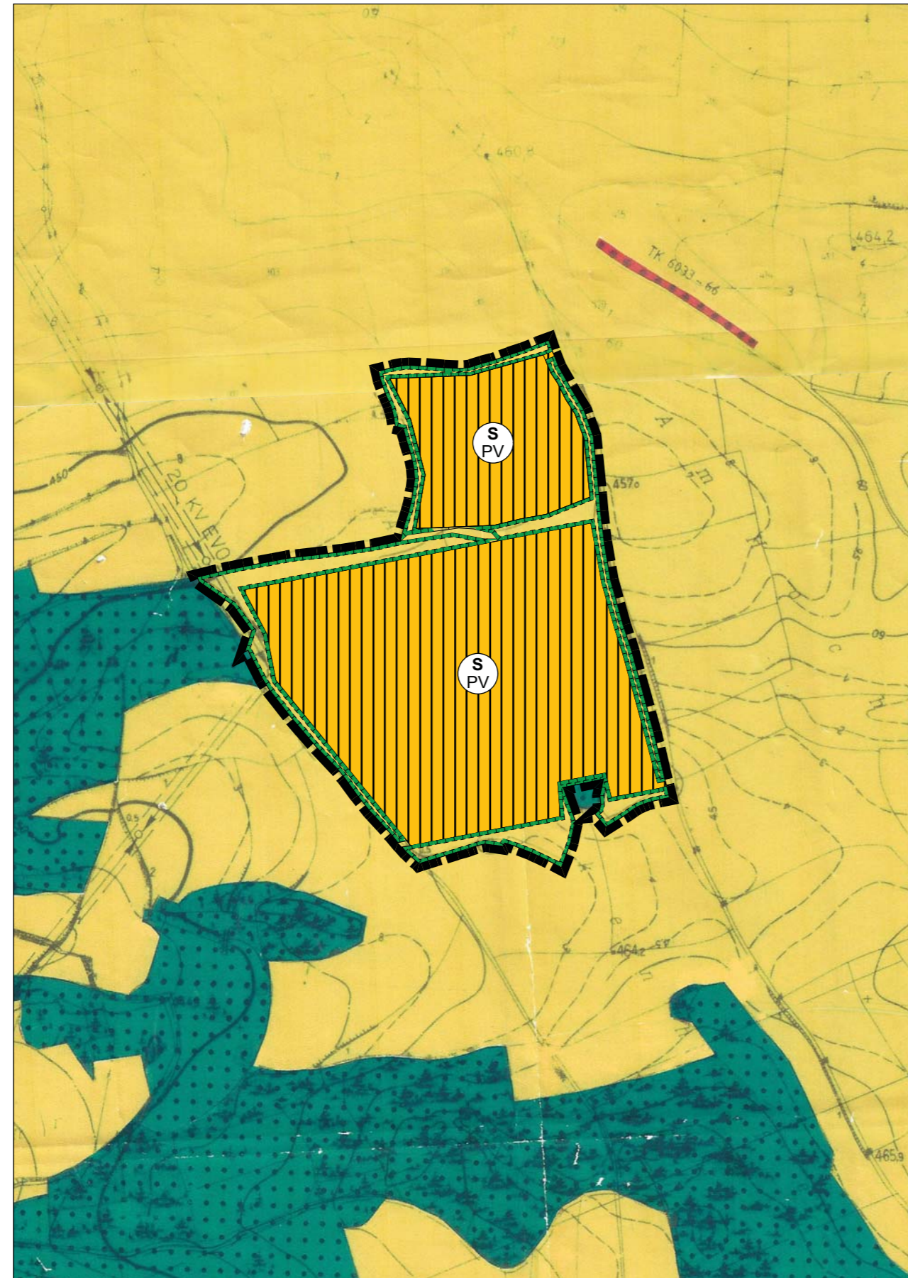
Kartengrundlage: Flächennutzungsplan, digitalisierte Fassung