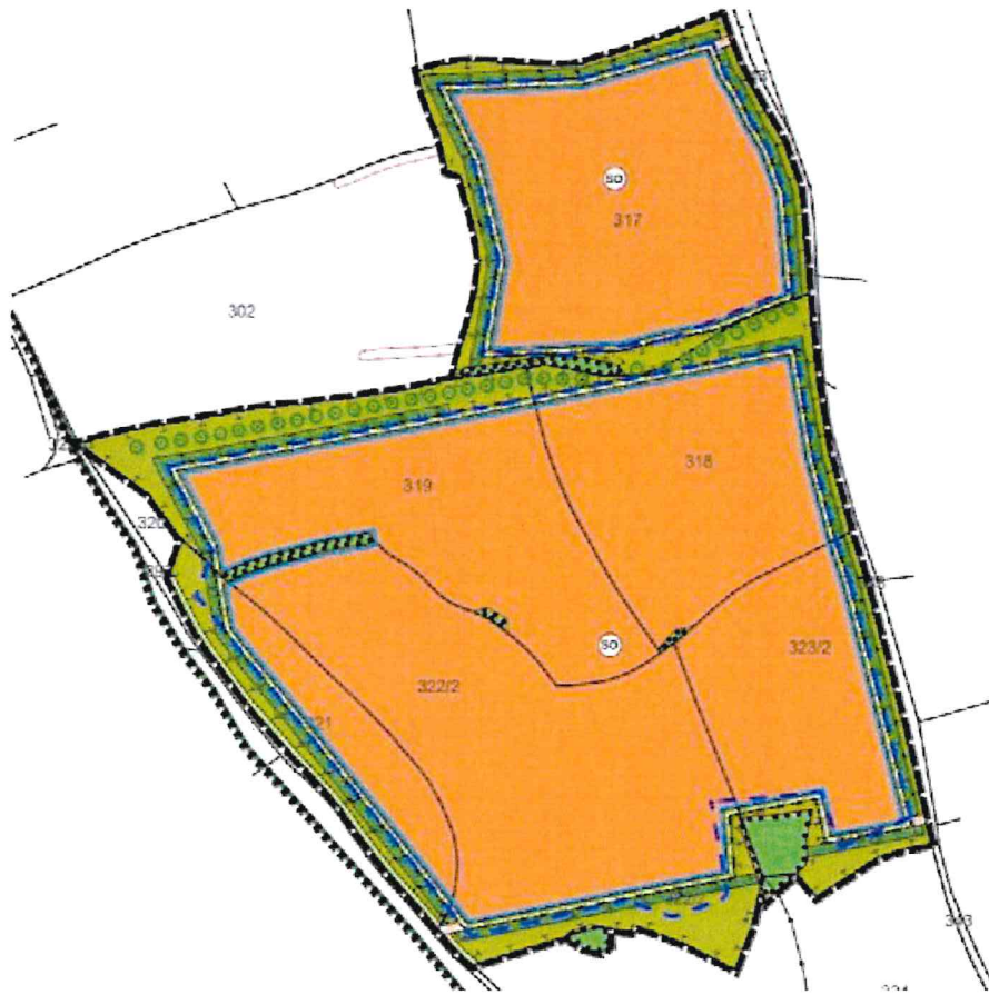
Abb. Geltungsbereich des Vorhabens (Ausschnitt BP ohne Maßstab)

Ferner sind für den Artenschutz auch externe Ausgleichsflächen erforderlich, die westlich des o.g. Vorhabens liegen (Fl.Nr. 398 Gmk. Neuhaus).