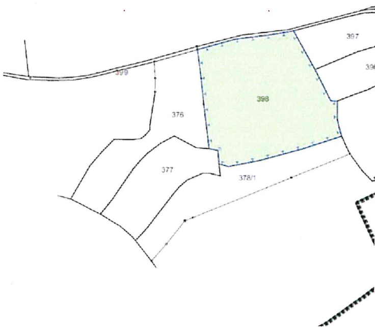
Abb. externe Ausgleichsfläche (ohne Maßstab)

Ferner sind für den Artenschutz auch externe Ausgleichsflächen erforderlich, die westlich des o.g. Vorhabens liegen (Fl.Nr. 398 Gmk. Neuhaus).